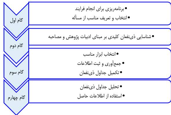
شکل ۱. روش‌شناسی پژوهش بر اساس مدل ۸ مرحله‌ای Kammi Schmeer در چهار گام

در این مرحله با توجه به عدم وجود اطلاعات مربوط به پزشکان، پرستاران و سایر افراد مشارکت‌کننده در فرایند غربالگری، تشخیص، درمان و نظارت بر درمان در سراسر کشور، به صورت تخمینی و با اطلاعات خبرگان شاغل در وزارت بهداشت، درمان و آموزش پزشکی، این جامعه ۴۰۰ نفر در نظر گرفته شد. با توجه به فرمول Cochran، حداقل نمونه ۱۹۶ نفر تخمین زده شد، اما با توجه به محیط پژوهش، این پرسش‌نامه که از ۱۳ شهریور ماه به اجرا درآمد، پس از تلاش‌های فراوان به دلیل خبرگی تکمیل‌کنندگان پرسش‌نامه، به ۵۴ نفر بسنده شد و پس از حدود یک ماه تلاش در جهت افزایش نمونه آماری، کار تحلیل آغاز گردید. همچنین، با توجه به اهمیت ارایه اطلاعات دموگرافیک شرکت‌کنندگان در پرسش‌نامه، نتایج در قالب شکل ۲ به تفکیک ارایه شد.