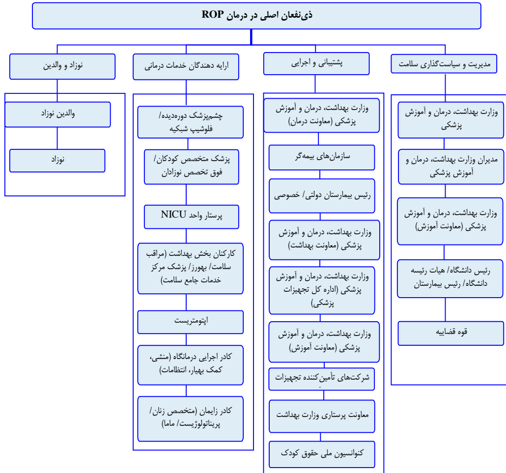
شکل ۳. ذی‌نفعان اصلی در فرایندهای غربالگری، شناسایی و درمان Retinopathy of prematurity (ROP)

درج شده‌اند. با توجه به این که امکان ثبت سایر ذی‌نفعان به صورت متنی وجود داشت، مواردی توسط آن‌ها درج شده است که پس از برگزاری جلسه با خبرگان و دریافت نظرات آنان، این گروه‌ها به ذی‌نفعان اضافه گردید. به عنوان مثال، در گروه دوم (پشتیبانی و اجرایی) معاونت پرستاری وزارت بهداشت، درمان و آموزش پزشکی و کنوانسیون ملی حقوق کودک و در گروه سوم (کادر درمانی) کادر اجرایی درمانگاه ROP (منشی، کمک بهیار، انتظامات)، کادر زایمان (متخصص زنان / پریناتولوژیست / ماما) و پزشک خانواده مرکز بهداشت به زیرگروه‌های مربوطه افزوده شد.